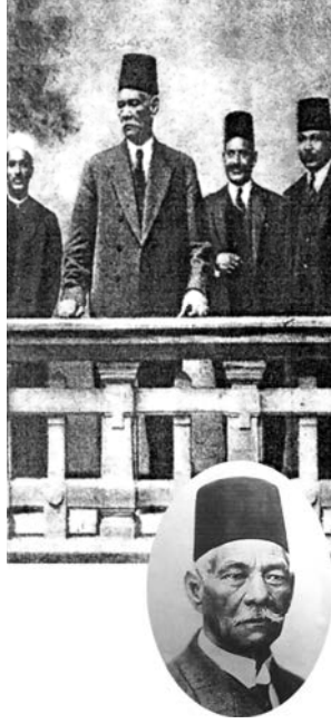
سعد زغلول باشا.