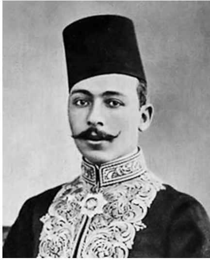
مصطفی کامل باشا.