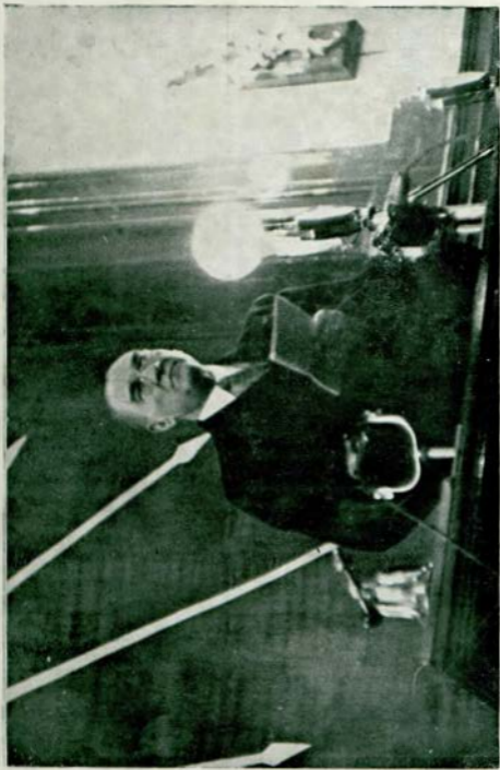
C. H. P. Dördüncü Büyük Kurultayında Genel Başkan ATATÜRK Söylevini verirken 9 Mayıs 1935