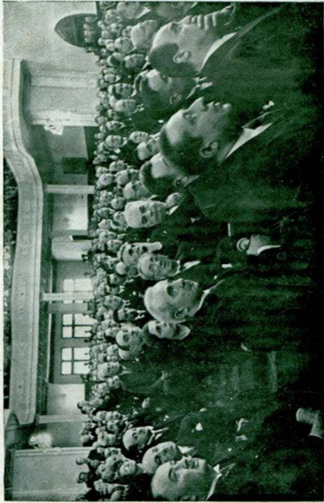
C. H. P. Dördüncü Büyük Kurultay, Genel Başkan ATATÜRK'ü dinlerken