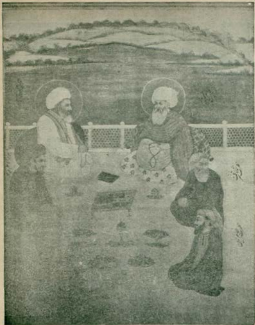
Rembrandt'a ilham veren eski Türk - Hind Mînyatürü