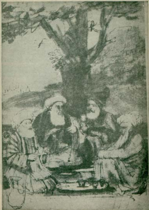
Rembrandt'ın bir Türkminyatüründen alınmış bir eseri