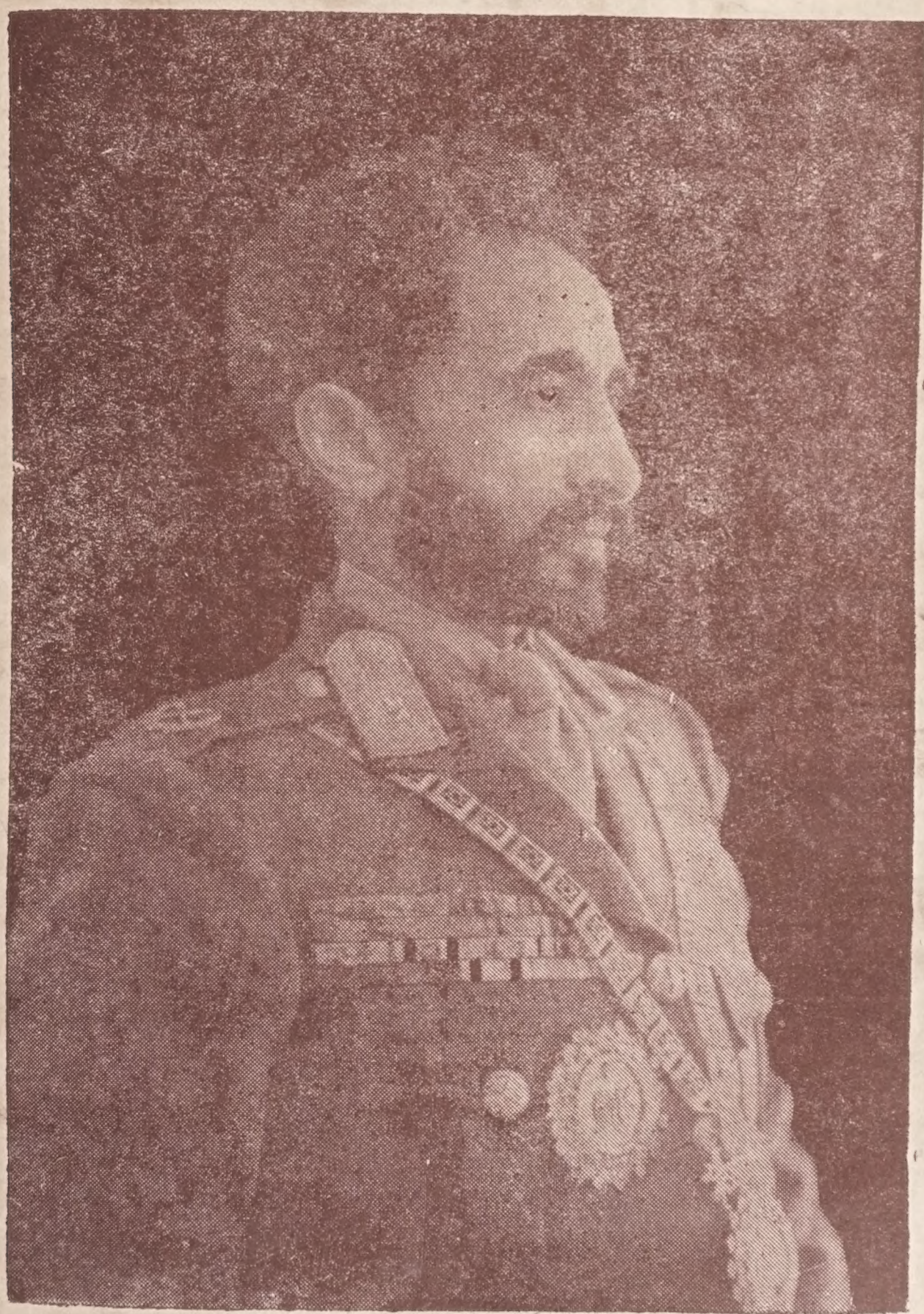
HIS IMPERIAL MAJESTY HAILE SELASSIE I EMPEROR OF ABYSSINIA.

(Letter of His Imperial Majesty's Private Secretary is inserted on page -2)