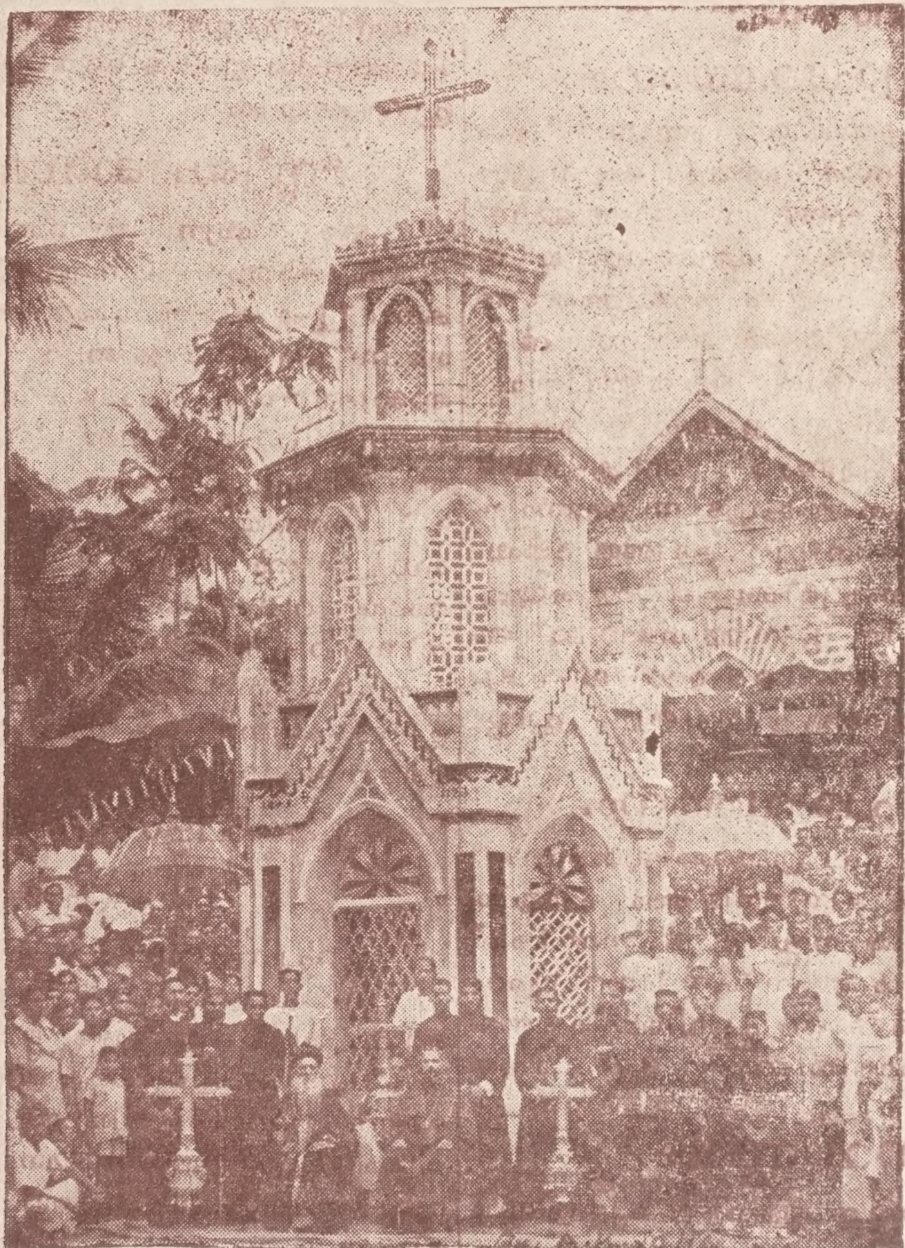
രണ്ടി സുറിയാനിപ്പള്ളി വകയായി സ്ഥാപിക്കപ്പെട്ടിട്ടുള്ള കുരിശ്.

പുസ്തകം 4 | 1950 ജൂലൈ, മിഥുനം 1125 | ലക്കം 9